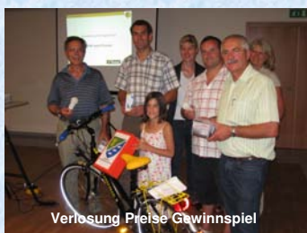
Verlosung Preise Gewinnspiel