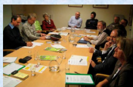
Auswertung Energiecheck - Vortrag